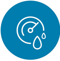
最大限度减少过度干燥