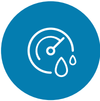
最大限度减少过度干燥